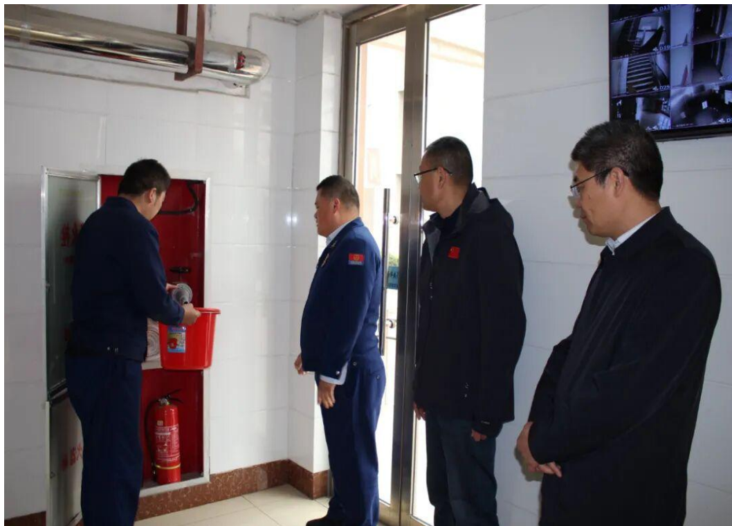
图8-1 临沂市体校开展消防安全专项检查

整改闭环管理，全力筑牢校园消防安全屏障，为师生营造更加安全、稳定、和谐的校园环境。