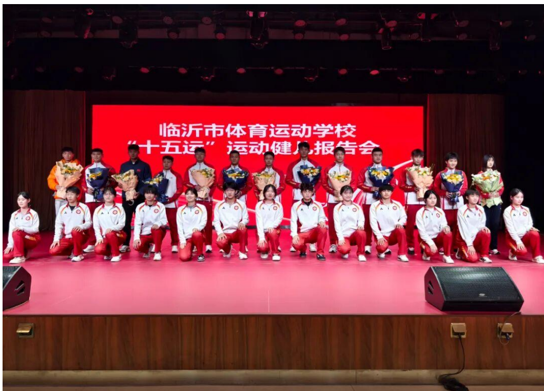
图2-7 体校举行“十五运”运动健儿报告会

11月26日，一众征战第十五届全国运动会的临沂市体校优秀校友载誉归来。这些来自射击、赛艇、摔跤、田径等多个项目的运动健儿，带着全运会赛场上的拼搏与荣誉，以一场丰富深刻的报告会，向母校师弟师妹们传递体育精神的磅礴力量，为校园注入炽热的奋斗气息。