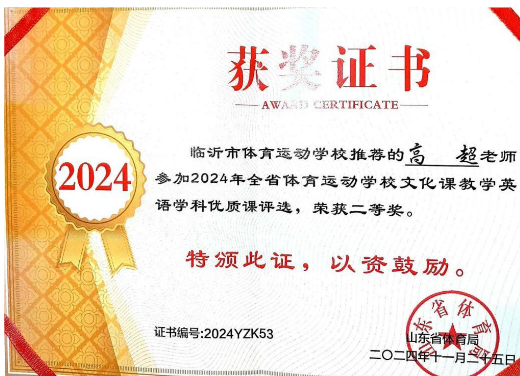
图3-1 体校教师在全省优质课评选获优异成绩

在推进课程实施过程中，学校注重推动信息技术与教学实践的深度融合，依托省级在线精品课程建设平台，加强数字化教学资源开发与应用，推广线上线下混合式教学模式，提升教学效率与课程质量。学校加强对教师信息化教学培训，提高教师教学设计能力和教学实施水平，临沂市体育运动学校2024年度在全省体校文化课教学优质课评选中实现了新的突破，其中一等奖4项，二等奖1项。（详见图3-1）