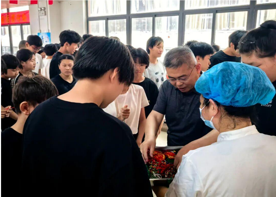
图2-3 “我们的节日·端午节”主题活动

以课程建设为立德树人畅通渠道。加快推进思政课程教育教学体系建设，配齐配足思政课教师和德育教师，开足开齐思政、美育、体育课程，发挥广大教师在课程教学中的育人作用。（详见图 2-4）