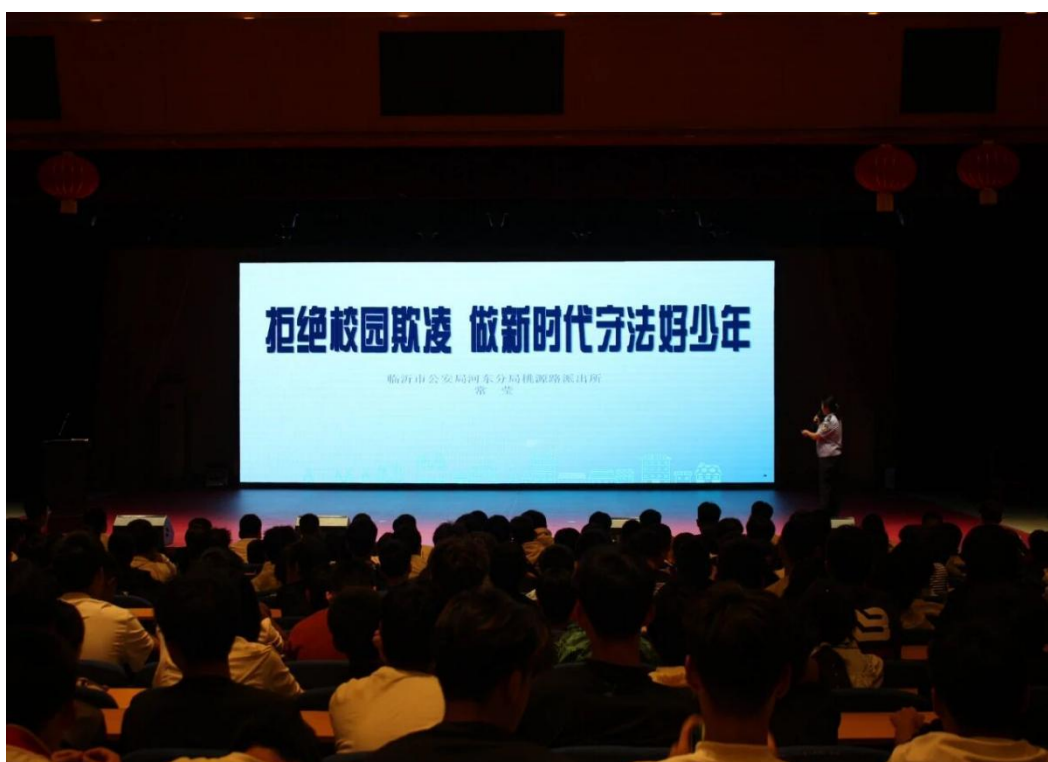
图2-2 开展校园欺凌防治与法治教育讲座

力与阅读习惯，营造浓厚的班级与校园读书氛围。（详见图 2-1）同时，学校还通过励志教育、生命教育、心理健康教育、法制教育等内容，引导学生树立积极人生态度，珍爱生命、乐观进取。在传承中华优秀传统文化和爱国主义教育方面，学校借助征文、演讲、辩论、讲座等多种形式，增强学生的民族自豪感与爱国情怀，帮助其树立正确的世界观、人生观和价值观，坚定“强技报国”的信念。（详见图 2-2）