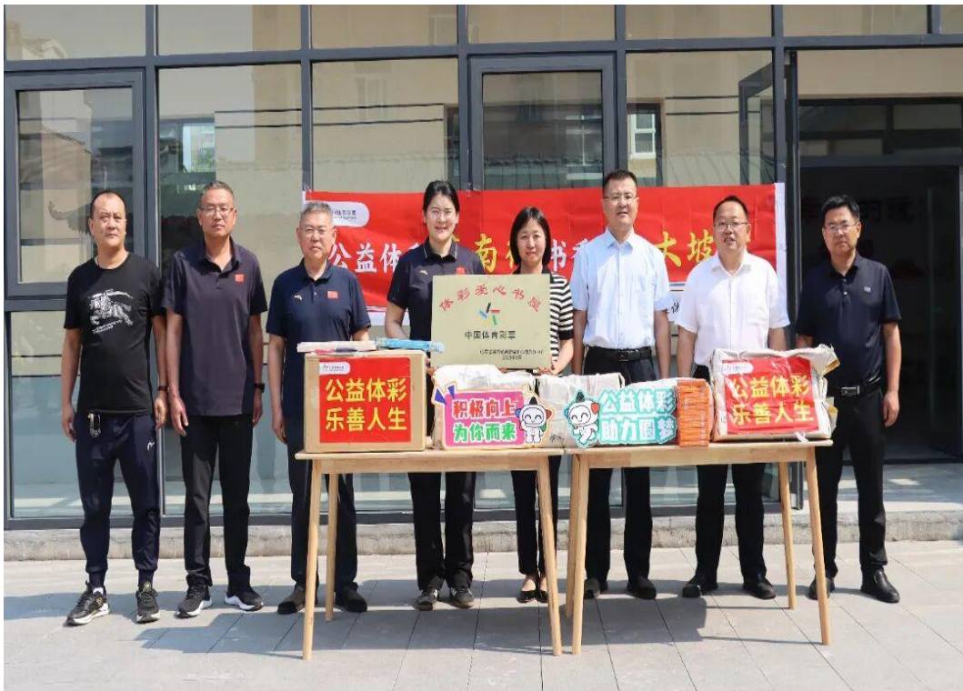
图4-4 市体校到第一书记帮扶村送“暖”

作，大坡村村容村貌焕然一新。为丰富当地群众精神文化生活，今年又在村内的孝善食堂区域建立了一个小型图书室。