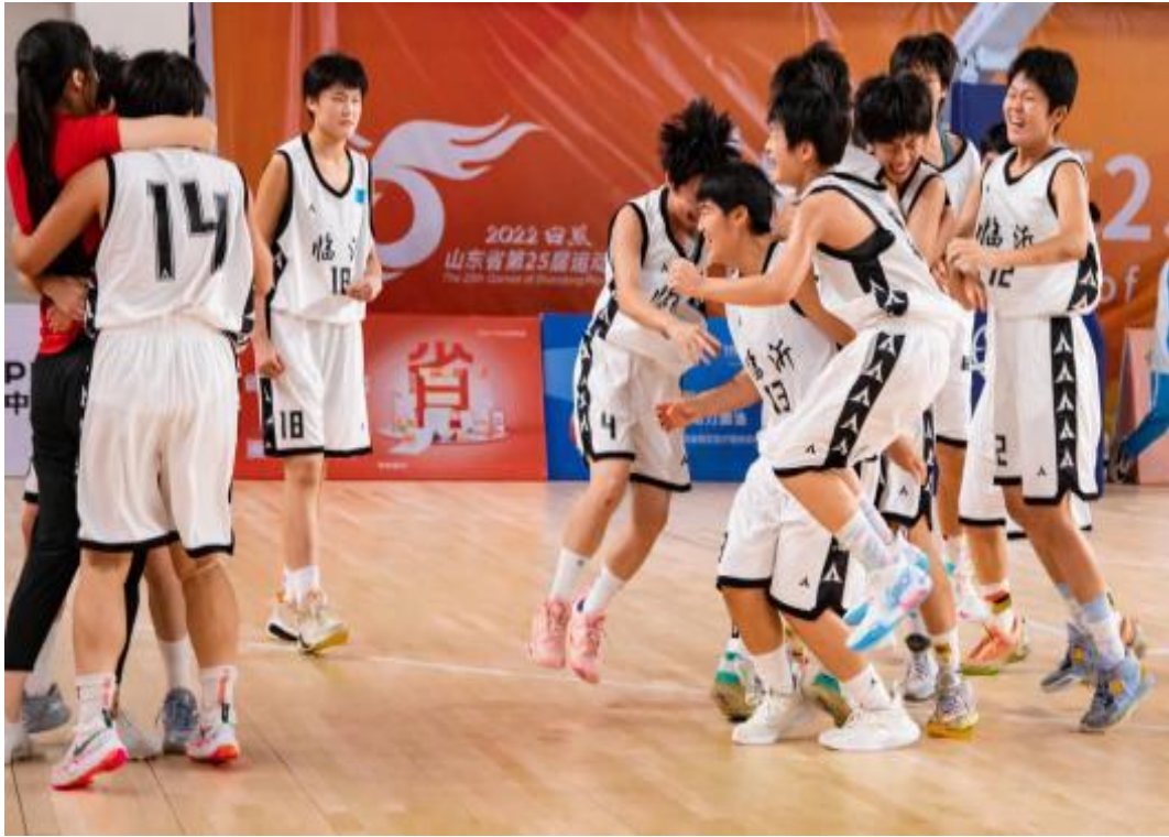
图4-1 合办篮球队参加省运会夺金