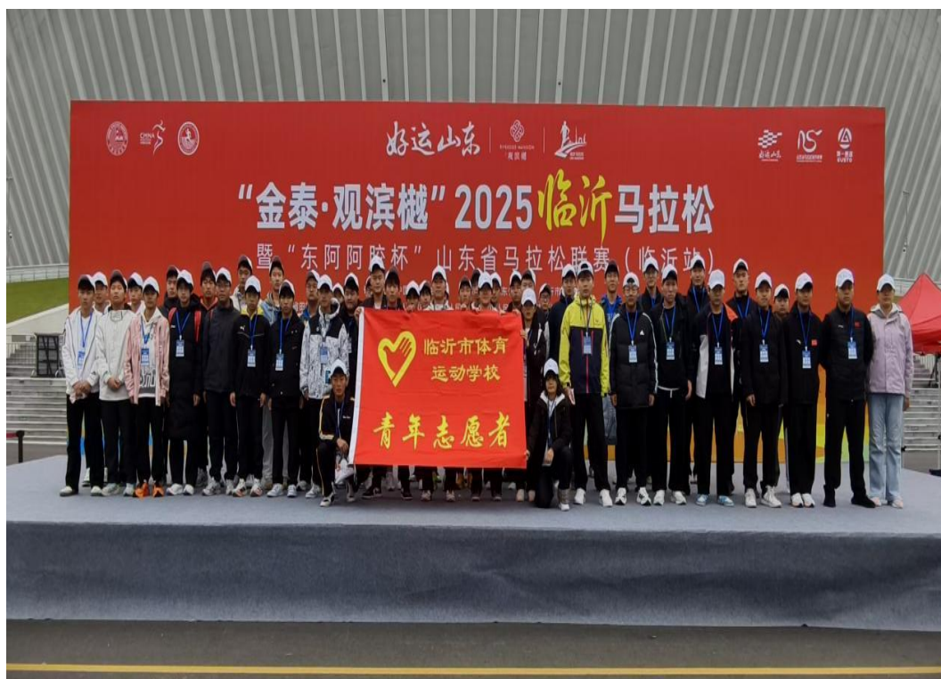
图4-5 临沂体校师生助力马拉松

更多师生则投入到赛事志愿服务工作中。从凌晨开始，志愿者们就已集结上岗，承担起安检辅助、计时协助、物资补给、赛道观察等多项工作。