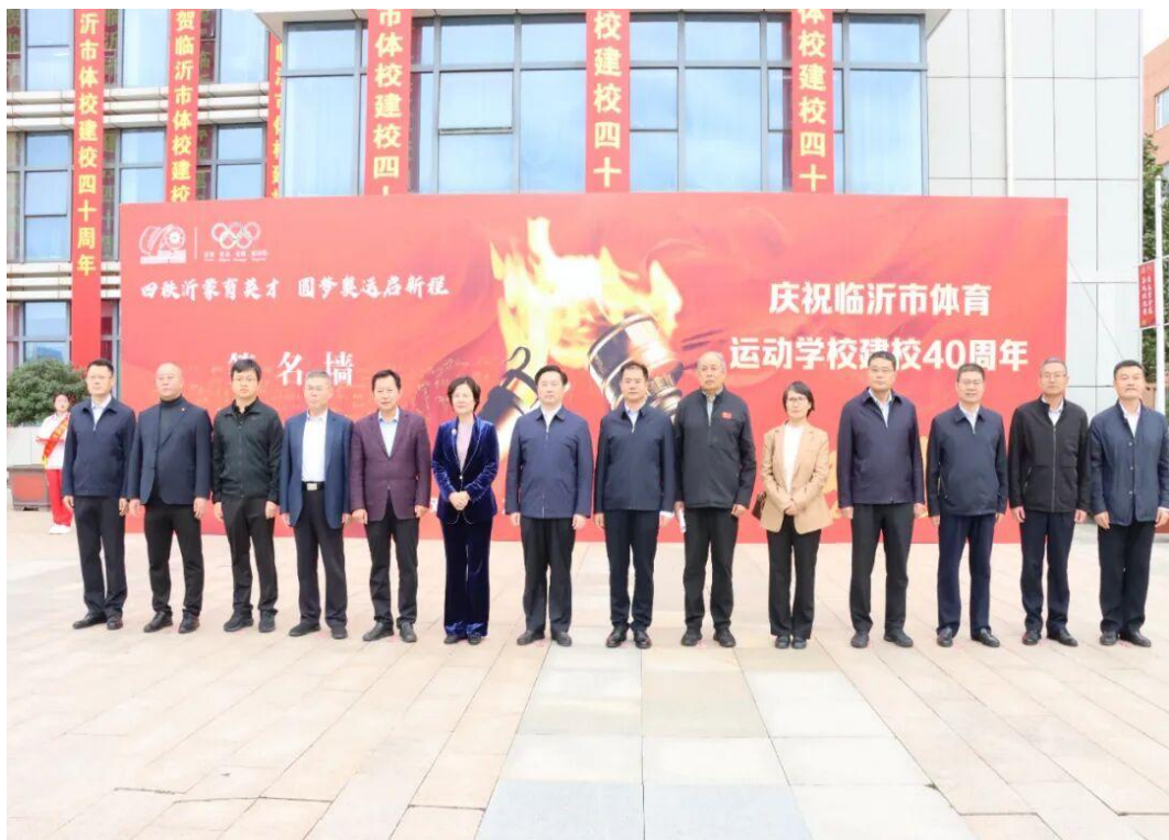
图5-1 临沂体校举行40周年校庆庆典

10月18日，临沂市体育运动学校校园内彩旗飘扬、宾朋云集，各级领导、嘉宾、校友及师生欢聚一堂，共同庆祝学校建校40周年，40载风雨兼程的办学历程，在此刻凝聚成一场致敬过往、奔赴未来的盛会。