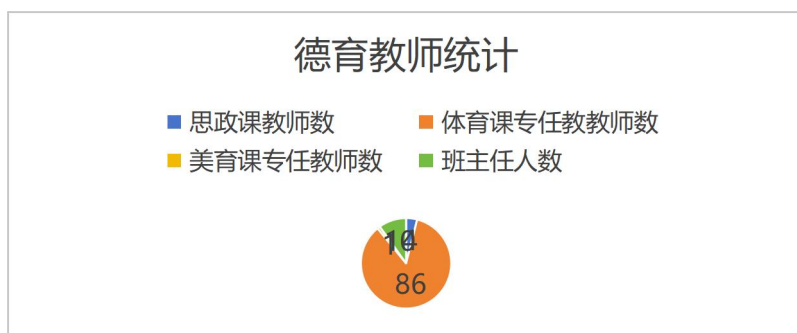
图2-4 德育工作教师统计

以课程建设为立德树人畅通渠道。加快推进思政课程教育教学体系建设，配齐配足思政课教师和德育教师，开足开齐思政、美育、体育课程，发挥广大教师在课程教学中的育人作用。（详见图 2-4）