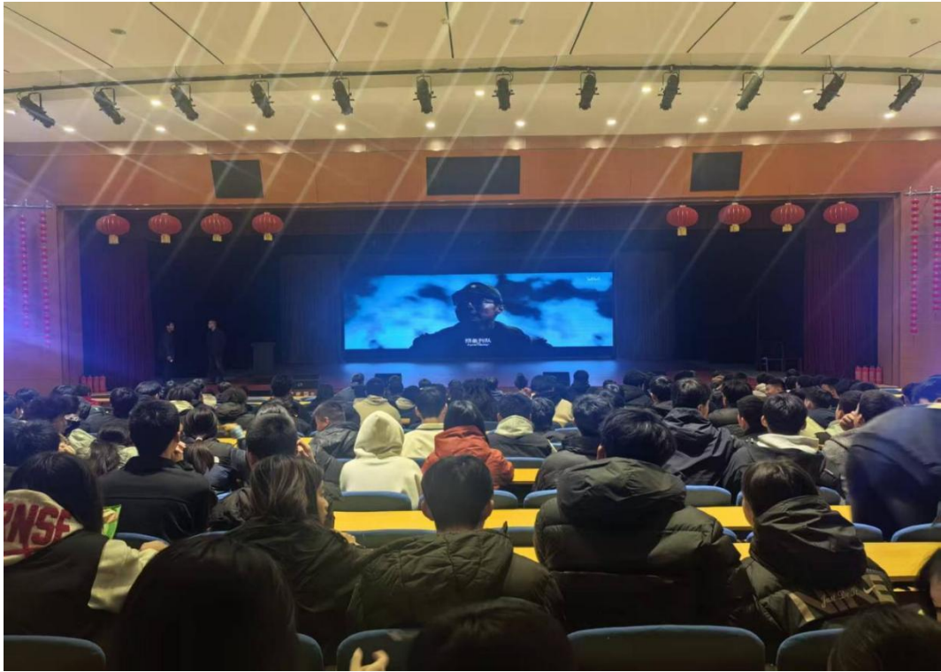
图5-2 市体校开展主题观影纪念活动