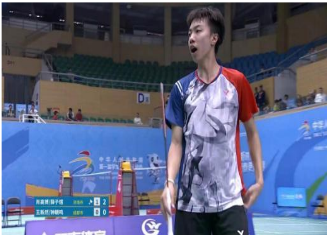
图7-1 输送运动员获学青会羽毛球团体冠军

1、与社会力量委托训练运动项目。学校在充分考虑服务竞技体育大环境发展需要的基础上，经学校体育项目设置委员会论证，结合学校教练员队伍的实际情况，在足球、网球和乒乓球等运动项目上采用与社会力量合作委托训练的方式联合办学，聘请各俱乐部中专业的教练员队伍负责学校上述运动项目的日常训练和队伍管理工作。（详见图7-1）