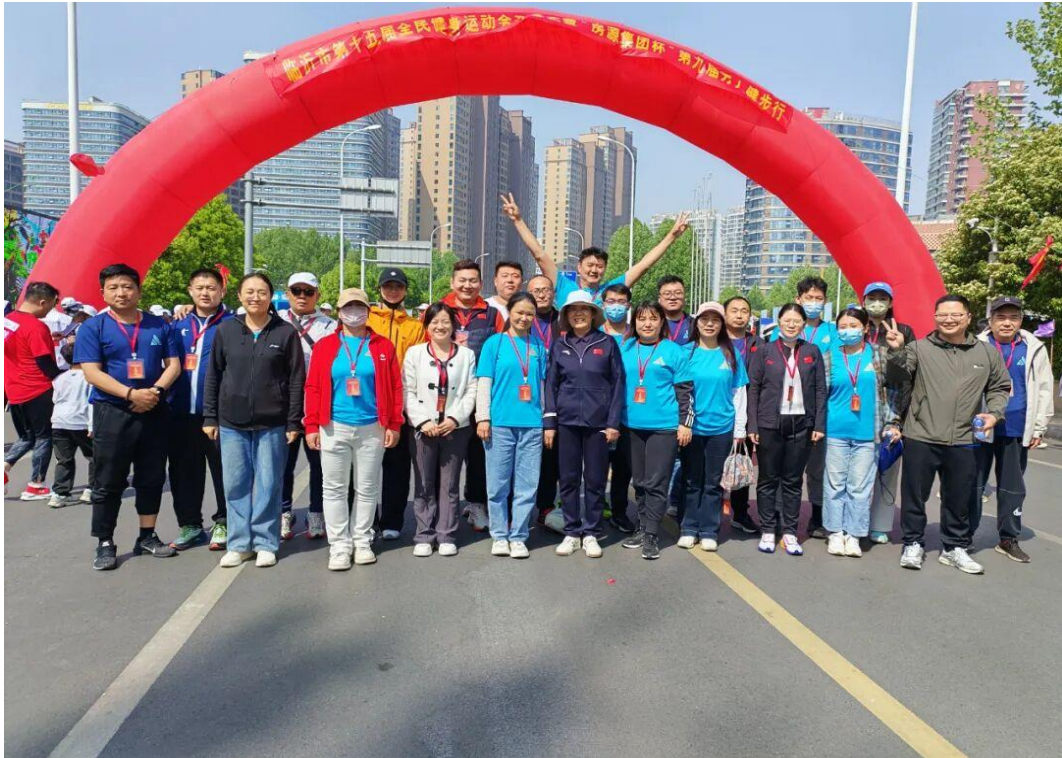
图4-3 体校教职工参与健步行志愿服务活动