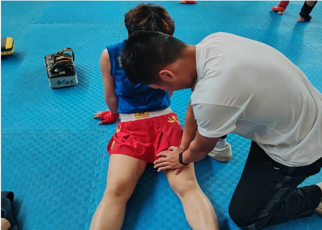
图7-3 体校学员助力山东省女子散打锦标赛

山东省女子武术散打锦标赛汇聚了全省各地市的散打精英，比赛竞争异常激烈。为确保运动员们能以最佳状态全身心投入比赛，同时守护好她们的身体健康，市体校康复技术专业学员积极投身赛事保障工作。