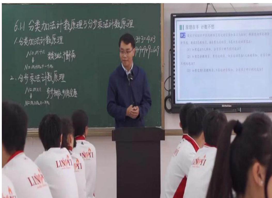
图3-4 文化课教师在全省优质课比赛获佳绩

下一步，临沂市体校文化课教师将继续努力，充分发挥优质课比赛的示范、引领和促进作用，进一步学习先进的教学理念，夯实过硬的教学基本功，研究恰当的教学方法，持续深化教学改革，争取在更多各级各类文化课教学比赛中实现更高突破，为学校教育教学的高质量发展作出贡献。