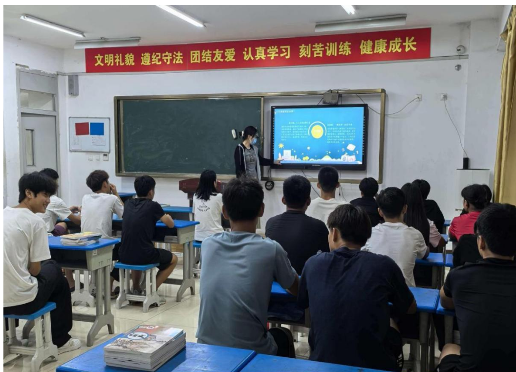
图5-3 市体校开展重阳节主题班会活动

未来，学校将继续深化德育教育，将传统文化融入日常教学，培养既有体育技能又具高尚品德的新时代体育人才。