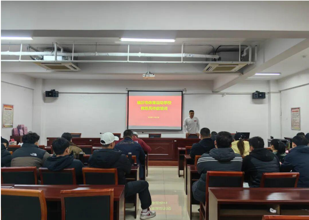
图7-2 临沂市体校举办教练员体能培训活动